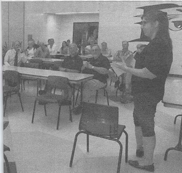
ation aux membres du conseil d'administration acadien provincial.

inistration du CSAP. » du même avis que le groupe Foyer-École et veulent eux aussi que l'agrandissement de l'école soit une priorité du CSAP.